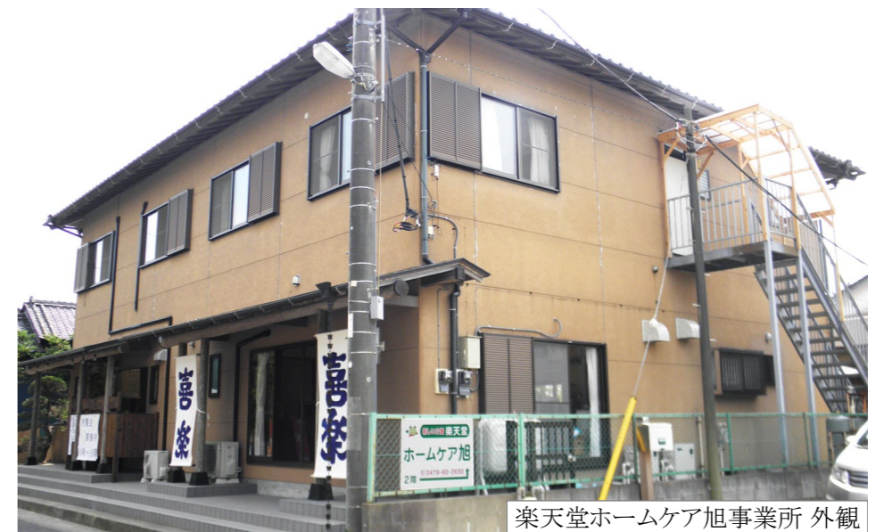
楽天堂ホームケア旭事業所 外観