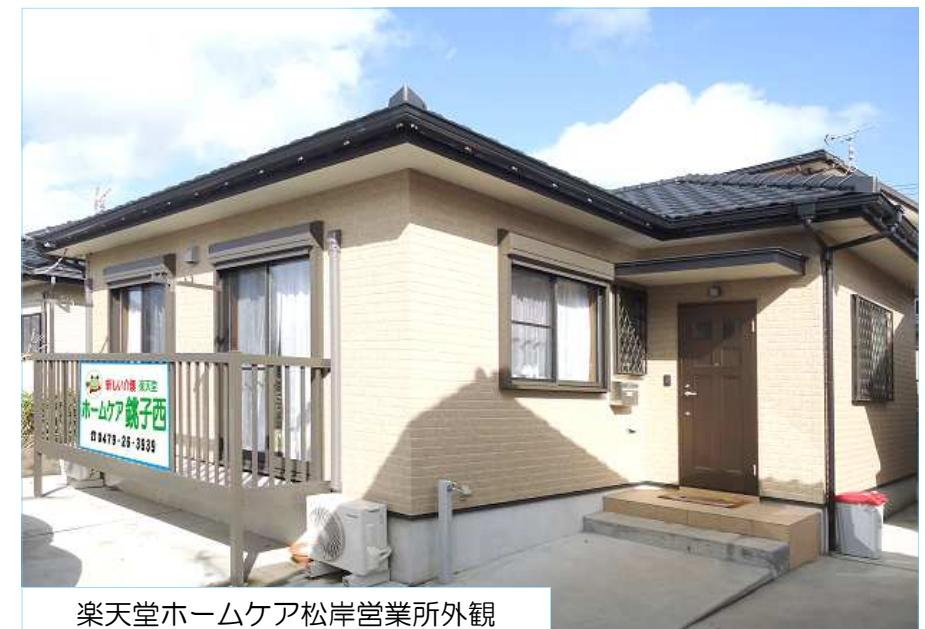
楽天堂ホームケア松岸営業所外観