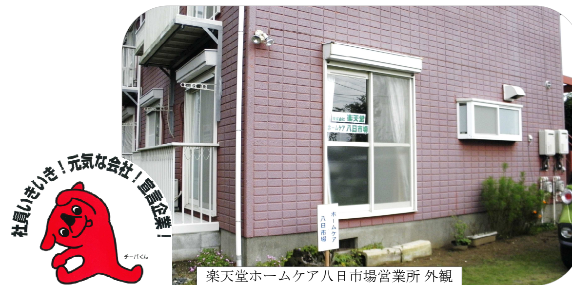
楽天堂ホームケア八日市場営業所 外観