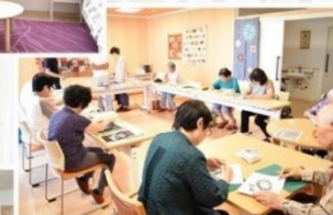
地域コミュニティルーム