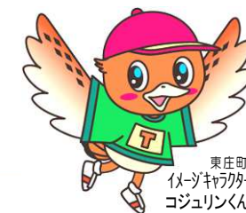
東庄町 イメージキャラクター コジュリンくん