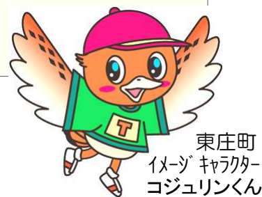
東庄町 イメージキャラクター コジュリンくん