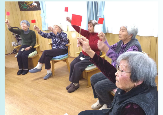
活動的なデイルーム