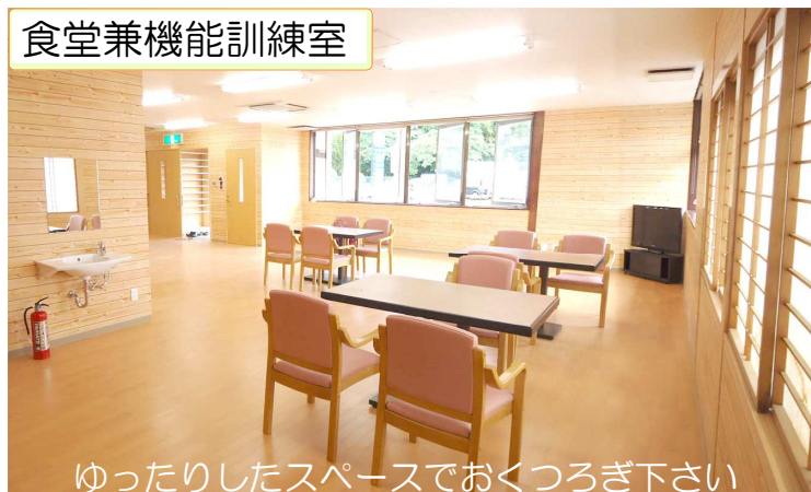
食堂兼機能訓練室