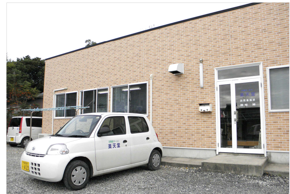
楽天堂訪問看護ステーション 外観